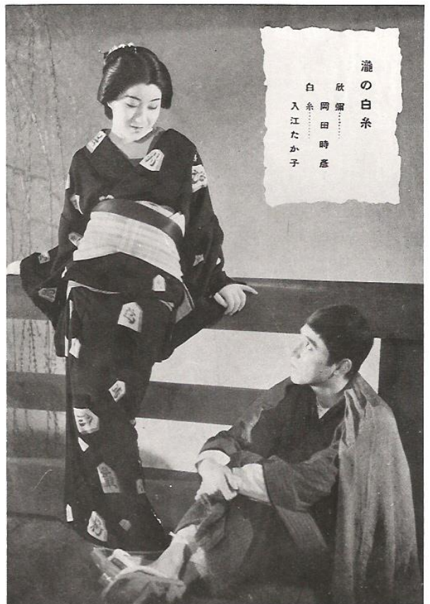
『瀧の白糸』