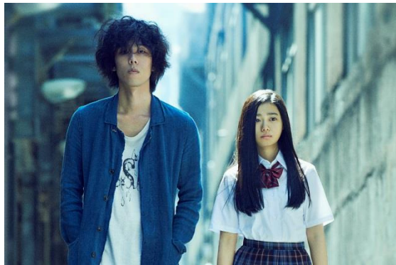
『トイレのピエタ』